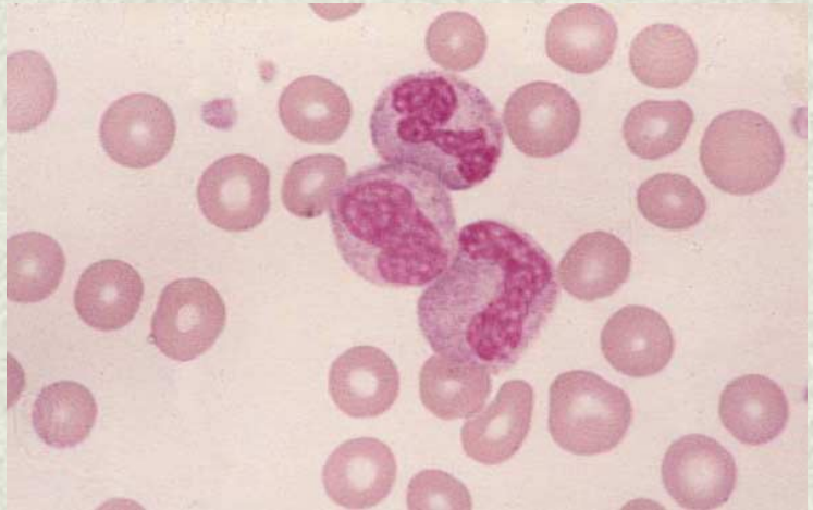
Morfología eritrocitaria en el diagnóstico de anemia.